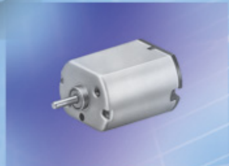
ブラシ付 DC モータ