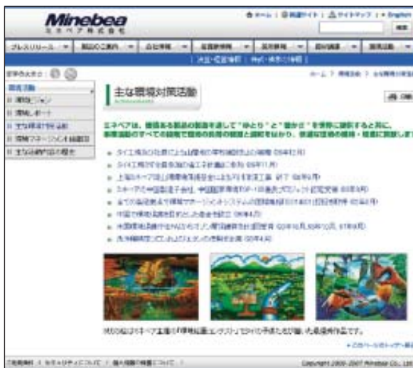
ミネベアの環境対策を紹介するホームページ

ご意見、お問い合わせ等につきましては、本誌裏表紙の「お問い合わせ先」にて受け付けています。