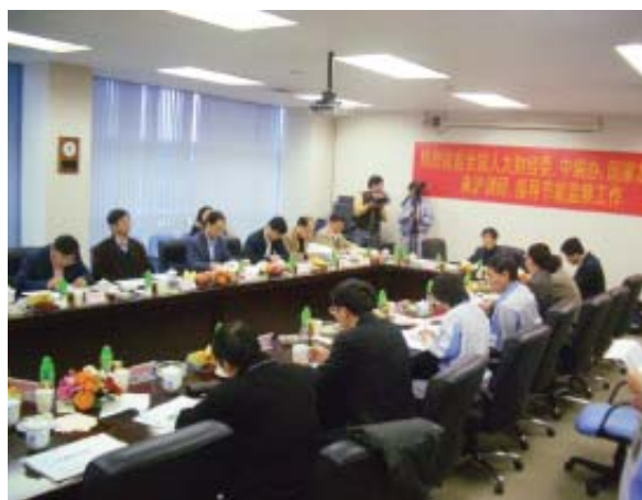
中央政府と上海ミネベアのミーティング

このような地道な努力が評価され、中国中央政府により、省エネ型先進企業の視察対象企業として選ばれ、高い評価を得ました。