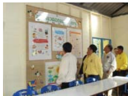
環境エネルギーコーナーの掲示版