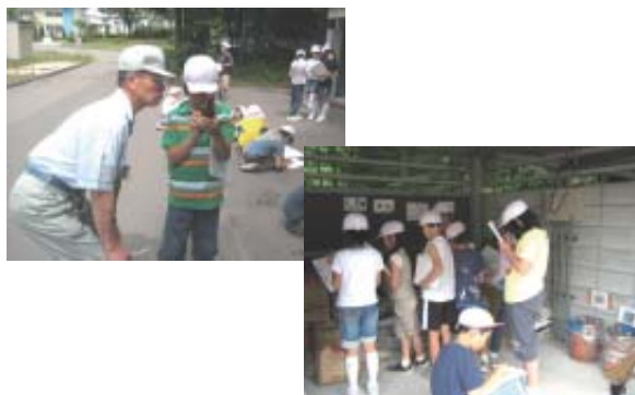
ミネベアの廃棄物の分別状況を学ぶ小学生

訪れた小学生は、分別状況について熱心にメモを取っていました。今後も近隣地域から参考とされるように、環境保全活動の取り組みを継続していきます。