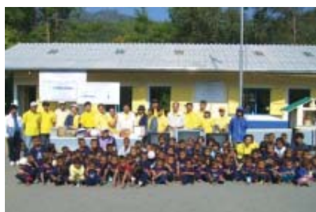
ミネベア・タイの社員とメーファールアン校の子供たち

そして、少しでも多くの子供たちが環境問題に関心を持ってくれることを願い、校舎の一角に環境エネルギーコーナーを設けて、環境やエネルギーに関する本や学習教材を常備しました。また、この校舎建設の様子はTHAI TV NATIONでドキュメンタリー番組としてタイ全国に放送されました。