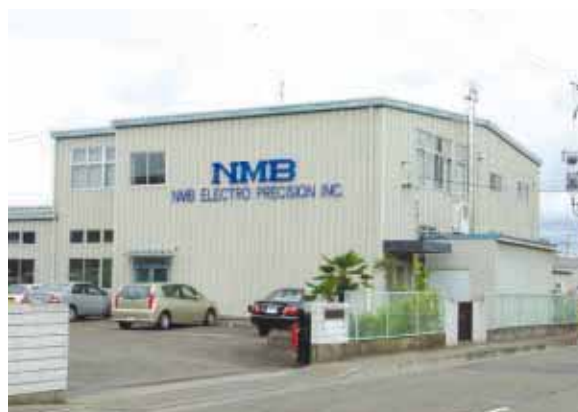
仙台まち美化サポートプログラムに参加するエヌ・エム・ビー電子精工(株)

エヌ・エム・ビー電子精工(仙台市)は、仙台市と市民・事業者とのパートナーシップで取り組む、新しいまち美化システム「仙台まち美化サポート・プログラム」にサポーターとして参加し、事業所周辺の除草、ゴミ拾い等を行っています。