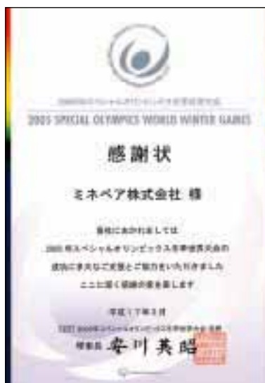
2005年スペシャルオリンピックス冬季世界大会主催者より贈られた感謝状

これは、ミネベアが長野県に本社を置く企業であり、また、当社の企業理念である「地域社会に歓迎されること」、並びに「国際社会の発展に貢献すること」に根ざしたものです。