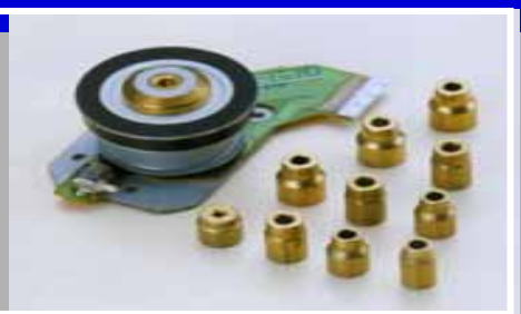
ポリゴンミラーモータ CD-ROM用モータ