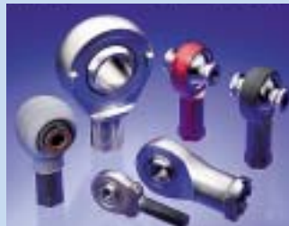
ロッドエンドベアリング

人体に例えた場合は関節の動きをする部分に使用される部品で、固定翼航空機の翼の可動部分やエンジンと翼の結合部、ハッチ(ドア)の開閉部分などに使用されます。航空機のほか、ヘリコプターや列車、自動車にも数多く使われています。