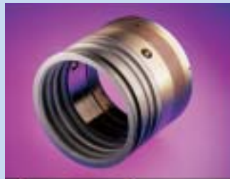
ジャーナルベアリング

ハードディスクドライブ(HDD)の磁気ヘッドアクチュエーターの支点部分に使用される部品で、ミネベアは世界市場のトップシェアを持っています。シャフトとスリーブの間にボールベアリングを1個または2個組み込んだ構造が基本です。