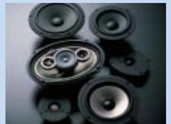
スピーカー/スピーカーボックス

プレス加工やプラスチック射出成形加工技術を活用したスピーカーの生産並びにボックスに組み込んだ形で、主に世界の主要オーディオメーカーに向けてOEM生産しています。