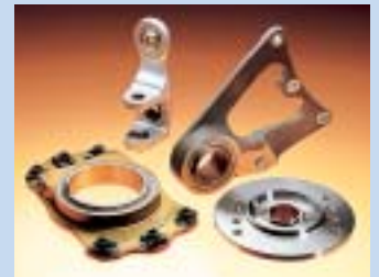
航空機用精密機械組立部品

ベアリングと機械加工部品を組み合わせた部品で、航空機用部品の結合部分などに数多く使用されています。