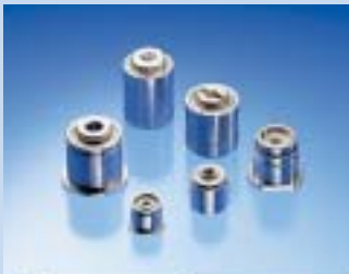
ピボットアッセンブリー

ハードディスクドライブ(HDD)の磁気ヘッドアクチュエーターの支点部分に使用される部品で、ミネベアは世界市場のトップシェアを持っています。シャフトとスリーブの間にボールベアリングを1個または2個組み込んだ構造が基本です。