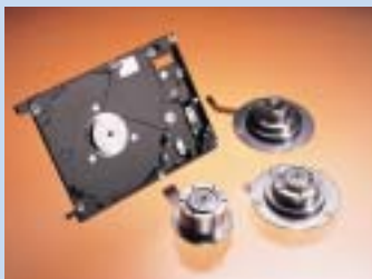
HDD用スピンドルモーター

ハードディスクドライブ(HDD)のハードディスクを回転させるモーターで、記憶容量や処理速度などHDDの性能を左右するため、回転数やNRRO(非繰返し性振れ)などの点で非常に高度な精度要求を満たすことが求められています。ミネベアはROベアリングを含むボールベアリングと流体軸受を内製しており、他の競合メーカーにない競争力を誇っています。