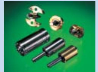
シャフト一体型ボールベアリング

シャフトに2本のボール溝を持ち、通常、2個使用するボールベアリングの内輪とシャフトを一体化した構造の特殊ベアリングで、ビデオカメラのシリンダーなどに使用されています。シャフトにボールベアリングを2個取り付けた場合に比べて回転精度が高くなります。